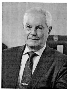
БЕДРИЦКИЙ Александр Иванович Президент Российского гидрометеорологического общества