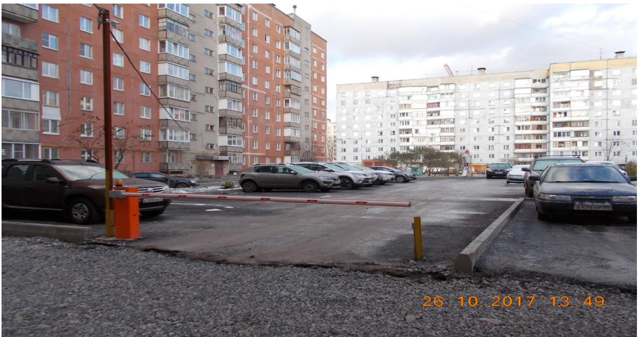
Фотография № 8. Оборудованная парковка ул. Городецкая, д.12

В течении 2017 года проводилась работа направленной на профилактику нарушений требований к размещению транспортных средств на участках не имеющих твердого покрытия, в том числе на участках с зелеными насаждениями (на газонах, цветниках, озеленённых площадках придомовых территорий многоквартирных домов или административных зданий); на детских, спортивных, хозяйственных площадках и площадках отдыха вне зависимости от времени года. Роль уполномоченного по работе с населением сводилась к определению наиболее проблемных дворовых территорий, с последующей организацией профилактических бесед с жителями тех многоквартирных домов, которым принадлежат данные земельные участки на предмет оборудования парковочной площадки во дворе дома. Наглядным результатом проделанной работы является современная оборудованная парковочная площадка у дома № 12 по ул. Городецкая.