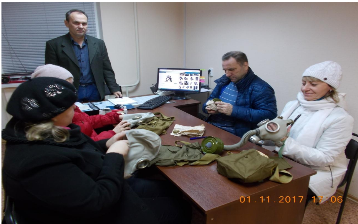
Фотография № 16. Проведения занятия по ГО и ЧС с неработающим населением

За отчётный период 2017 года было проведено 41 занятие, обучено 82 человека.