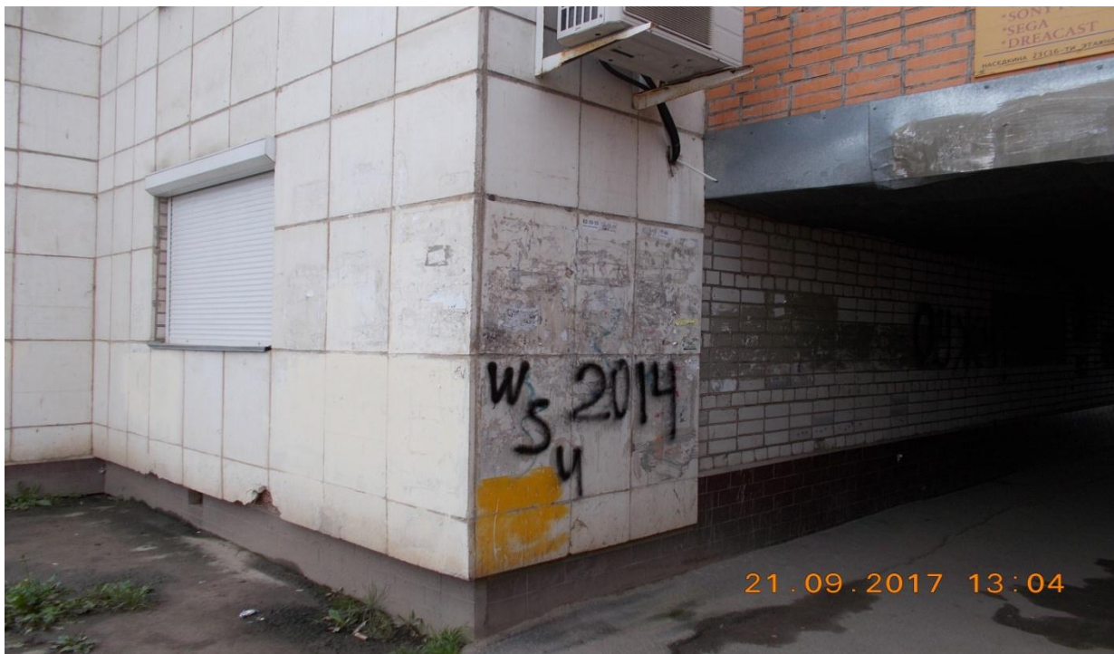
Фотография № 3. Несанкционированные надписи на фасаде дома, Октябрьский пр. 49

-для оперативного устранения выявленных нарушений, находящихся в компетенции управляющих компаний, ТСЖ, ЖСК с ними осуществляется взаимодействие по следующему алгоритму: представителю УК, ЖСК (ТСЖ) по телефону (при этом осуществляется запись в журнал телефонограмм) или в личном общении доводится выявленное нарушение, устанавливается срок устранения, как правило, один-два дня. В указанный срок, уполномоченный по работе с населением, осуществляет контроль выполнения. В случае устранения нарушения в установленный срок УК, ТСЖ (ЖСК) в дальнейшем не привлекаются к мерам административного воздействия. Вопрос решён «в рабочем порядке» и в ЦПП представляется докладная выявления нарушения с указанием времени устранения;