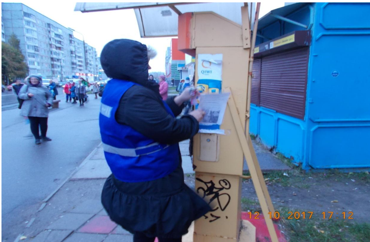
Фотография № 6. Акция «Каждой рекламе своё место»

В летний период 2017 года на территории города реализовывался Комплексный план мероприятий по обеспечению порядка в общественных местах, предназначенных для отдыха горожан.