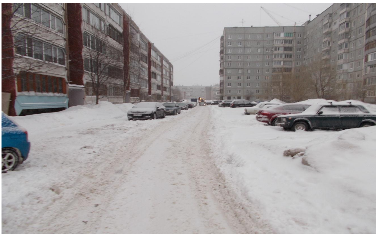
Фотография № 4. Несвоевременная уборка снега с проезжей части, ул. Любецкая, д.49

-для оперативного устранения выявленных нарушений, находящихся в компетенции управляющих компаний, ТСЖ, ЖСК с ними осуществляется взаимодействие по следующему алгоритму: представителю УК, ЖСК (ТСЖ) по телефону (при этом осуществляется запись в журнал телефонограмм) или в личном общении доводится выявленное нарушение, устанавливается срок устранения, как правило, один-два дня. В указанный срок, уполномоченный по работе с населением, осуществляет контроль выполнения. В случае устранения нарушения в установленный срок УК, ТСЖ (ЖСК) в дальнейшем не привлекаются к мерам административного воздействия. Вопрос решён «в рабочем порядке» и в ЦПП представляется докладная выявления нарушения с указанием времени устранения;