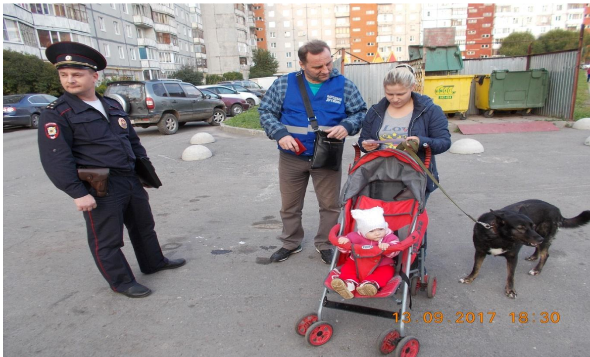
Фотография № 15. Участие членов народной дружины 115 мкр. в акции «Познакомь питомца с чистым городом».

Дружинники участвуют в выявлении нарушений в сфере благоустройства, вручают повестки участковых уполномоченных полиции, предупреждения и уведомления контролирующих органов, участвуют в розыске транспортных средств должников по линии ФССП.