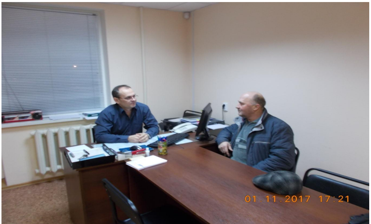
Фотография № 10. Приём граждан УРН в филиале ЦПП.

В 2017 году, приём граждан руководителями органов мэрии в филиалах ЦПП приостановлено. Приём граждан руководителями органов мэрии осуществляется непосредственно в структурных подразделениях мэрии, что обеспечивает повышение эффективности в работе с населением. Запись на приём можно осуществить через сайт города «Cherinfo». Помощь в этом может оказать уполномоченный по работе с населением.