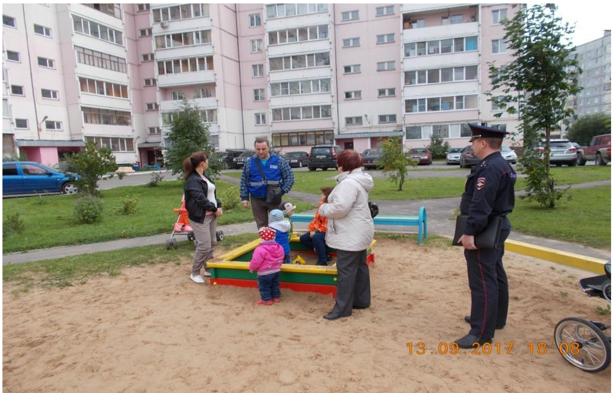
Фотография № 14. Совместный рейд народных дружинников 115 мкр. с участковым уполномоченным полиции по детским игровым площадкам.

Дружинники участвуют в выявлении нарушений в сфере благоустройства, вручают повестки участковых уполномоченных полиции, предупреждения и уведомления контролирующих органов, участвуют в розыске транспортных средств должников по линии ФССП.