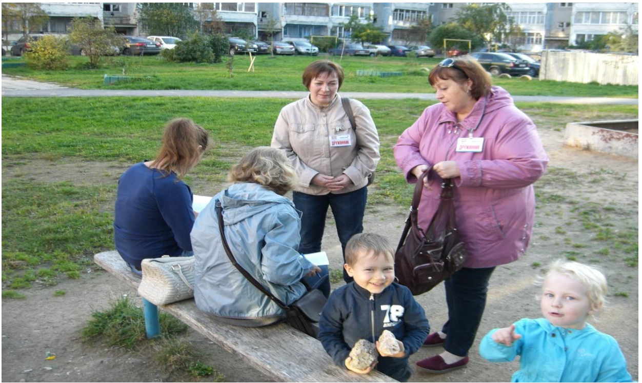
Фотография № 7. Акция «Береги свой двор, парк, сквер, город»

В течении 2017 года проводилась работа направленной на профилактику нарушений требований к размещению транспортных средств на участках не имеющих твердого покрытия, в том числе на участках с зелеными насаждениями (на газонах, цветниках, озеленённых площадках придомовых территорий многоквартирных домов или административных зданий); на детских, спортивных, хозяйственных площадках и площадках отдыха вне зависимости от времени года. Роль уполномоченного по работе с населением сводилась к определению наиболее проблемных дворовых территорий, с последующей организацией профилактических бесед с жителями тех многоквартирных домов, которым принадлежат данные земельные участки на предмет оборудования парковочной площадки во дворе дома. Наглядным результатом проделанной работы является современная оборудованная парковочная площадка у дома № 12 по ул. Городецкая.