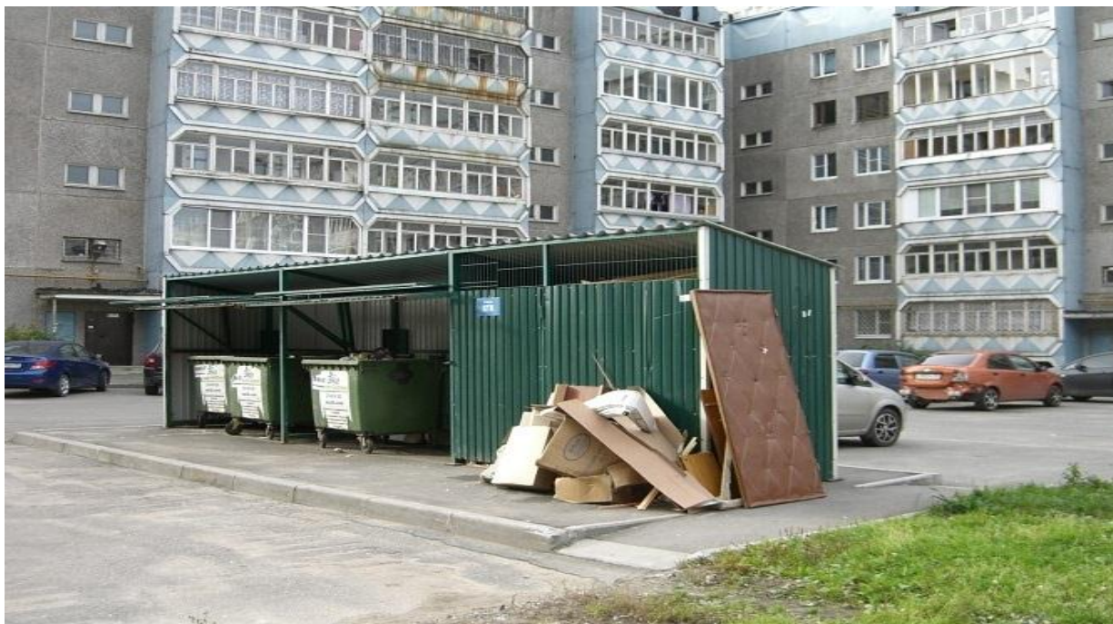
Фотография № 11. Склаживание бытовых отходов вне контейнерной площадки.

Жители микрорайона принимают участие в реализации проекта «Народный контроль». Было направлено 24 материала с последующим контролем за устранением недостатков. В основном это выявление наледи, некачественная уборка дворовых территорий, несвоевременный вывоз мусора, парковка транспорта на зелёных газонах (детских площадках). Все нарушения, выполненные в рамках вышеуказанного проекта, были выявлены на территории курируемого микрорайона.