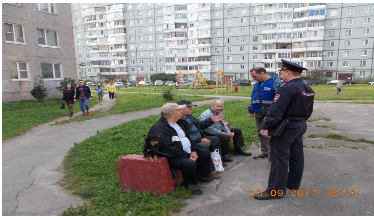
Фотография № 9. Рейдовое мероприятие совместно с участковым уполномоченным полиции по детским площадкам. Проведение профилактической беседы.

В рамках реализации Комплексного плана по обеспечению порядка в общественных местах, предназначенных для отдыха граждан особое внимание было уделено вопросам пресечения правонарушений общественного порядка на детских площадках. С мая по сентябрь включительно в каждую среду, в вечернее время проводились рейдовые мероприятия совместно с участковыми уполномоченными полиции и членами народной дружины на детские площадки. Особое внимание уделялось распитию спиртных напитков, курению и выгулу домашних животных на детских площадках. В ходе рейдов составлено 2 протокола за потребление (распитие) алкогольной продукции и за курение табачных изделий на территориях детских площадок, проведены 36 профилактических бесед с гражданами, нарушающими общественный порядок и Правила благоустройства территории города.