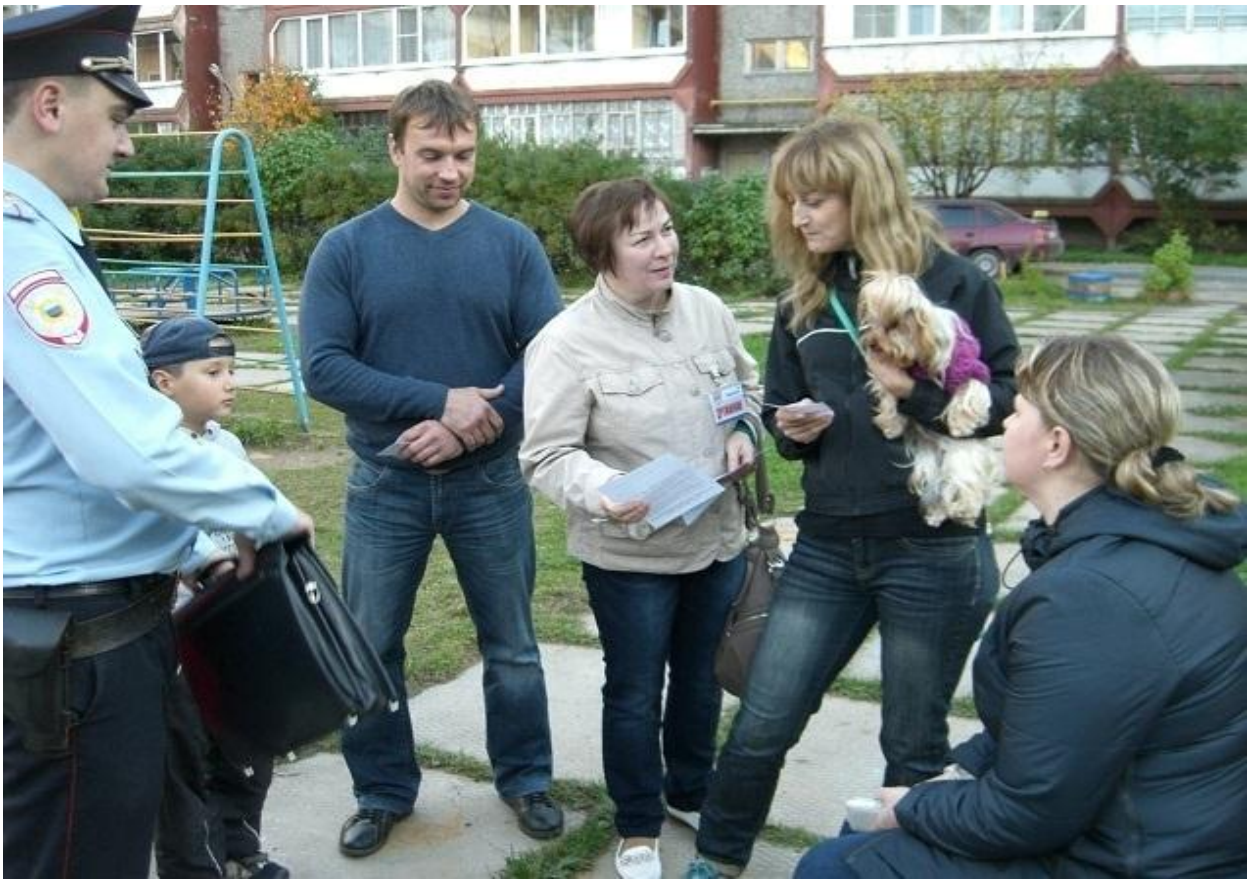
Фотография № 17. Информационно разъяснительная беседа с владельцами домашних животных.

4. В зимний период не производится своевременная уборка снега, наледи, сосулек. В летний период времени не своевременно скашивается трава. Осенью не убираются листья с газонов. В связи с этим, по выявленным нарушениям производилась и производится фото-фиксация и составляются материалы, которые отправлялись в комитет по контролю благоустройства и охраны окружающей среды, ДЖКХ для принятия решения.