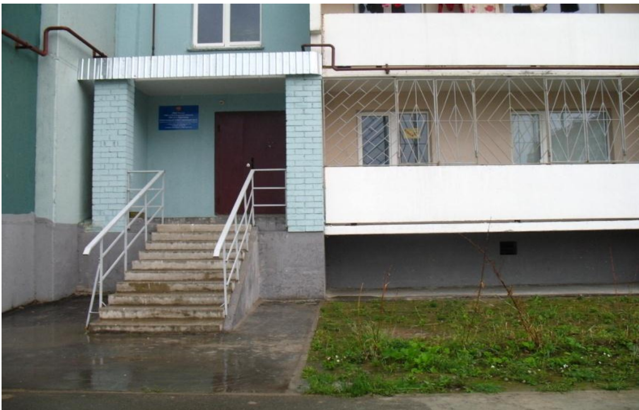
Фотография №1. Филиал Центра профилактики правонарушений 115 микрорайона.

Главная цель работы УРН - предупреждение правонарушений, выявление и устранение причин и условий, способствующих их совершению, принятие профилактических мер, направленных на предупреждение правонарушений, снижение преступности.