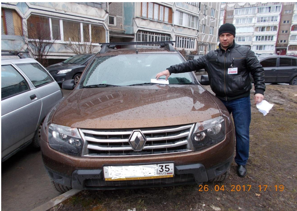
Фотография № 5. Акция «Парковка по правилам»