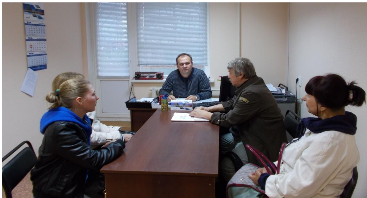
Фотография № 12. Проведение Совета профилактики 115 микрорайона.

2. О предотвращении преступлений, совершённых мошенниками.