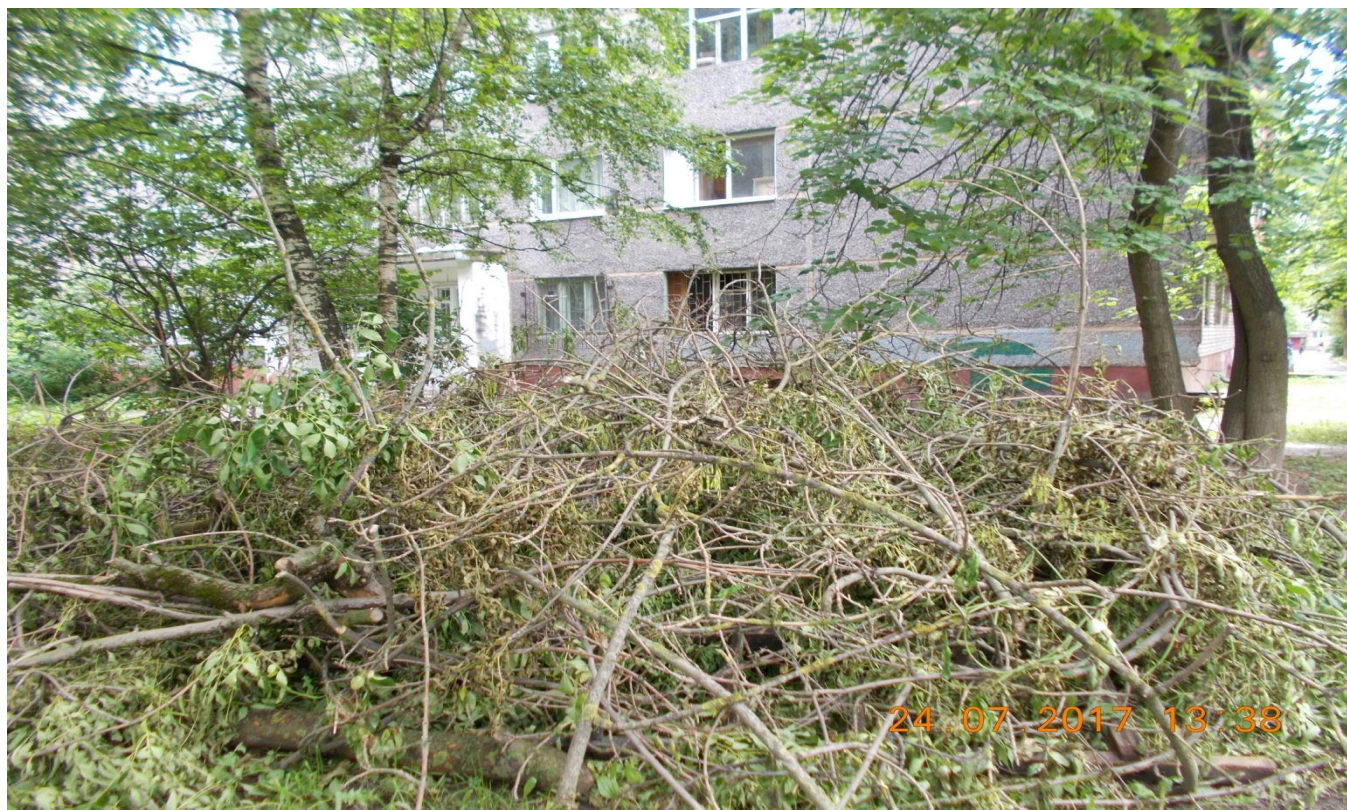
Фото № 7. Нарушения ПБТ г. Череповца.