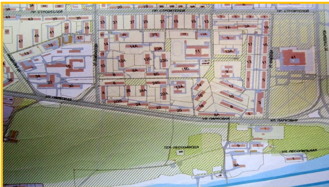
Фото № 2. План - схема 8 микрорайона.

На территории 8 микрорайона расположено 9 социальных объектов: