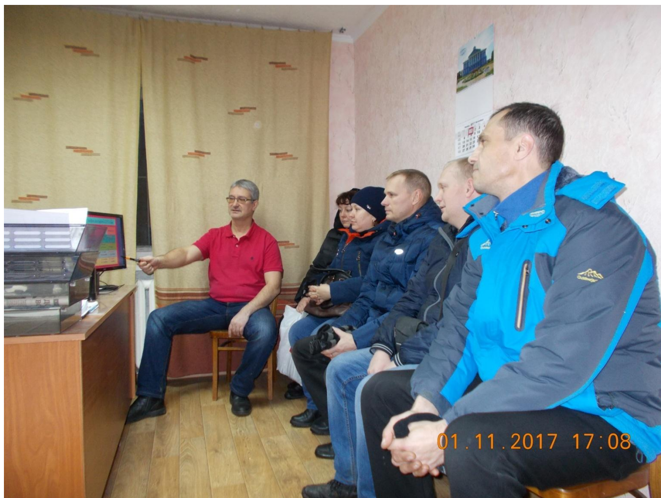
Фото № 3. Обучение по ГО и ЧС.