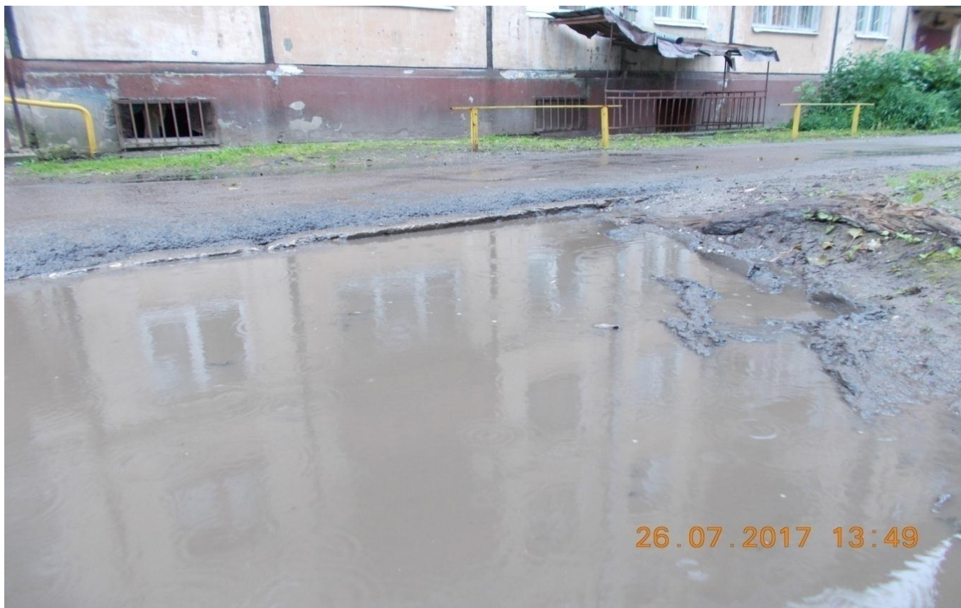
Фото № 8. Нарушения ПБТ г. Череповца.