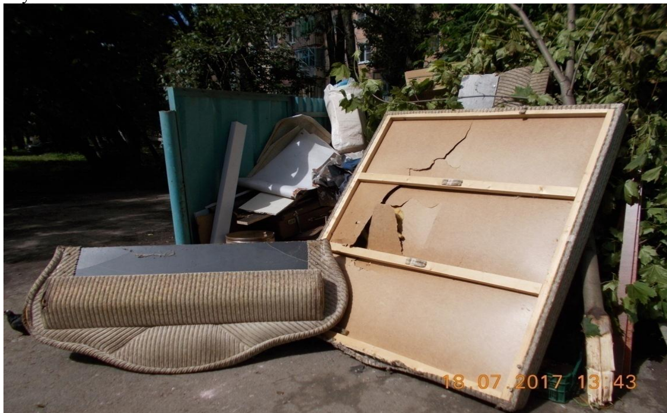
Фото № 6. Нарушения ПБТ г. Череповца.

обработки ПГМ, плохое водоотведение, захламление территории мусором, повреждение фасадов зданий, несанкционированные надписи и расклеенные в неустановленных местах объявления.