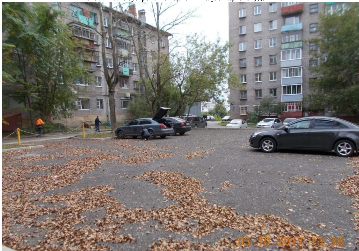
Фото № 11. Обустройство парковки на ул. Мамлеева, дом 3.