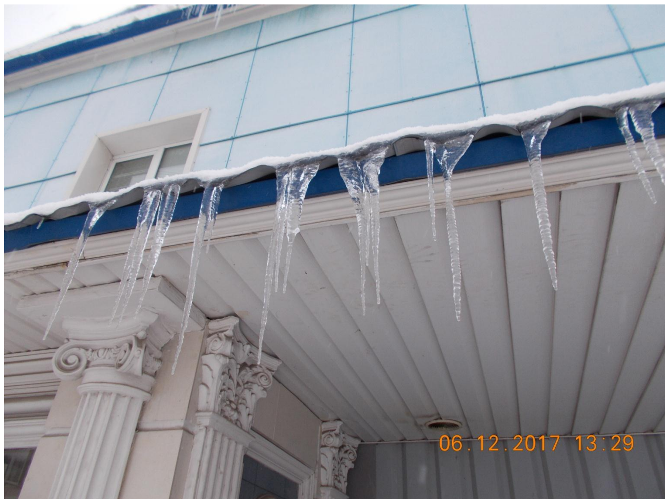
Фото № 9. Нарушения ПБТ г. Череповца.