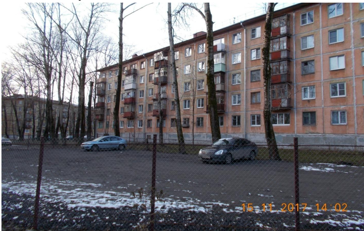
Фото № 10. Обустройство парковки на ул. Парковой, дом 14.