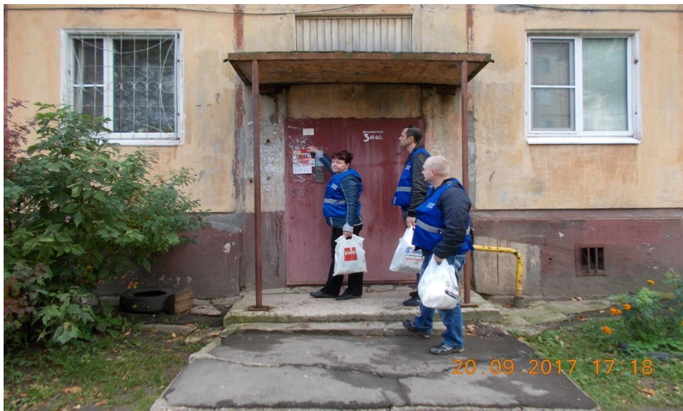
Фото № 5. Деятельность НД 8 микрорайона по профилактике правонарушений.