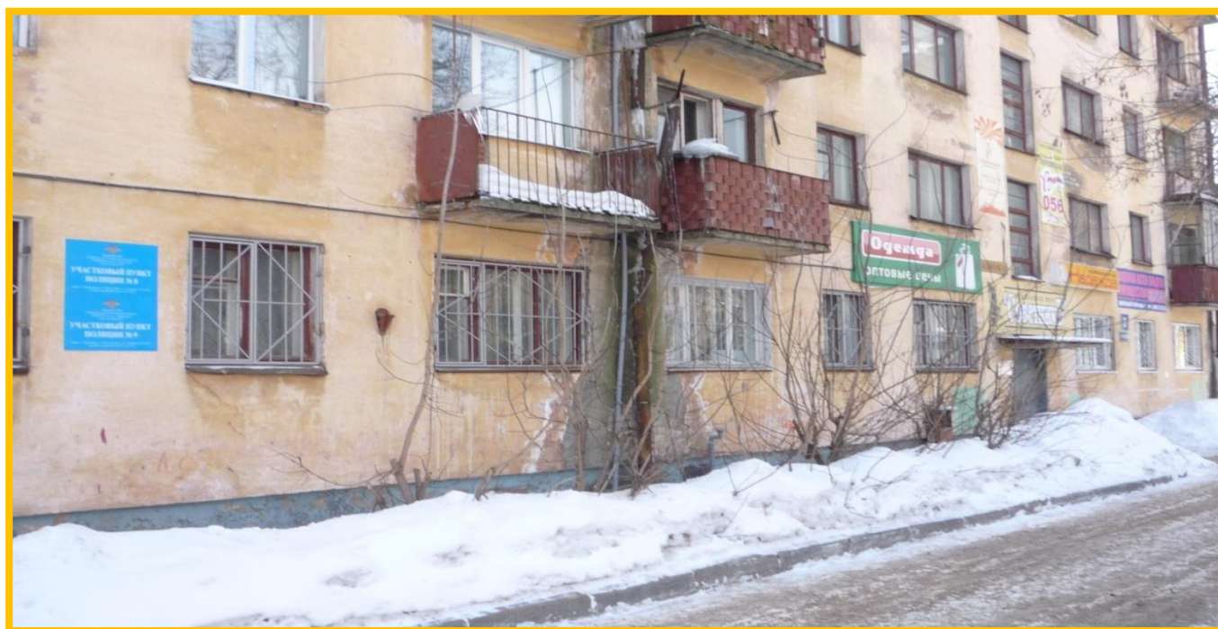
Фото № 1. Филиал Центра профилактики правонарушений (ул. Менделеева, дом 3)

Основной задачей в работе уполномоченного по работе с населением является – обеспечение безопасного и комфортного проживания жителей 8 микрорайона города Череповца.