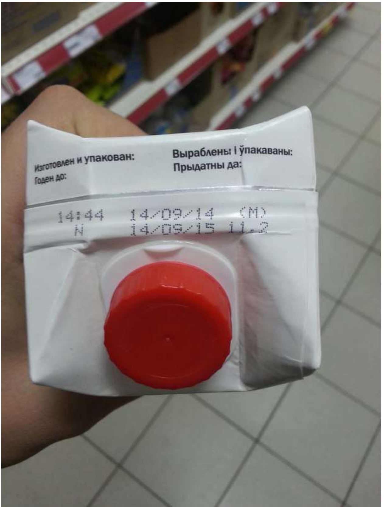
16. Магазін «» пр. Победы 148