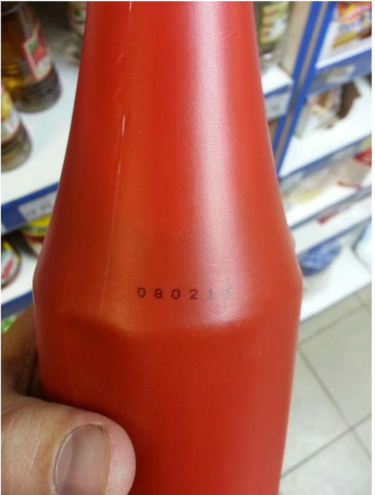
11. Магазин «» ул. Бардина 3