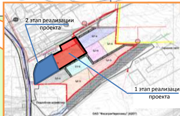
Территория Индустриального парка «Череповец»